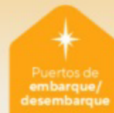
Puertos de embarque/desembarque